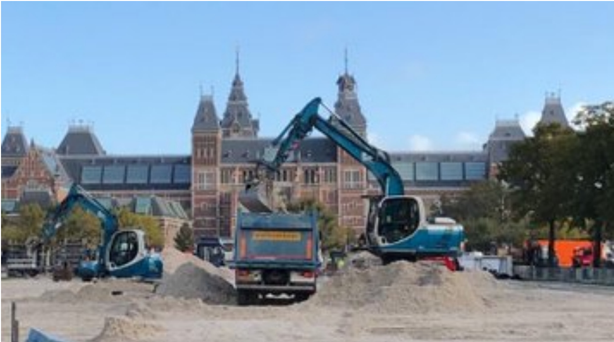
Foto's opbouw Polo Amsterdam 2018

en ...de toestand van de grasmat na een Polo-evenement