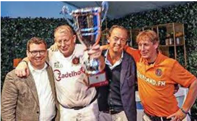
Afterparty Polo Museumplein Amsterdam

Er is hier iets erg misgegaan. Per ongeluk misschien, maar toch. Tegen die achtergrond, feiten die pas dit jaar boven tafel zijn gekomen, past het niet om de nu gevraagde vergunning dit keer te verlenen.